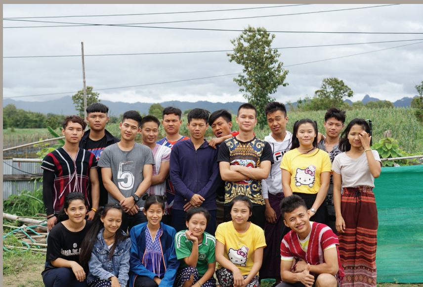
Studentene ved GED programmet

I Myanmar har kun 18.8% av befolkningen en videregående opplæring. For studenter fra etniske delstater, er det enda flere barrierer til å få en videregående opplæring. For å kunne søke på et universitet må disse studentene ta General Education Diploma (GED) prøven. GED gjør at de er kvalifisert til å søke på universitet i hele verden.